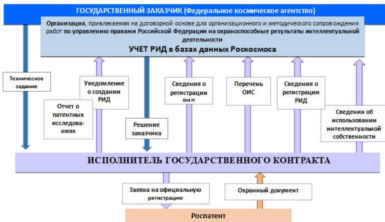
Рис. 2. Исполнение государственного контракта в части управления правами на результаты интеллектуальной деятельности и ведение государственного реестра

Схематично процесс управления правами на результаты интеллектуальной деятельности и ведение государственного реестра государственного заказчика, включая порядок поступления информации в ведомственные базы данных с учетом выявленных ответственных подразделений Роскосмоса, отражен на рис. 2.